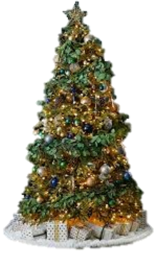
árbol de Navidad