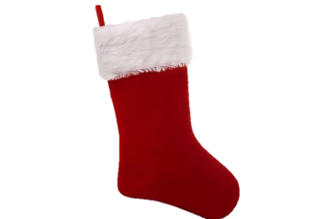
medias de Navidad